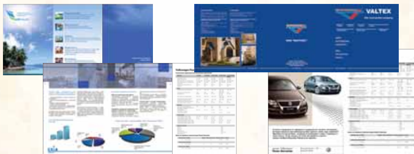
Евробуклеты А4 (150 г глянец на 2 фальца)

Буклет формирует имидж компании. Качество и грамотное оформление буклета - основные критерии для данного вида продукции. Буклет содержит ответы на все основные вопросы, которые могут возникнуть у Вашего покупателя.