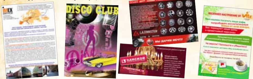
Листовки Флаера 115 г глянец

Листовка - бумажный носитель с текстом (изображением), предназначена для распространения среди потенциальных потребителей Вашего товара или услуги, рекламирующая ваши преимущества.